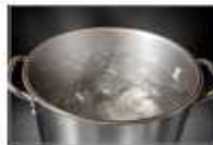
조리도구 열탕소독 또는 염소소독 실시