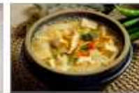
무더운 여름에는 가열(75℃ 이상)식품 위주로 섭취