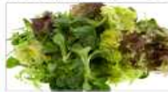
시금치, 상추 등 생채소, 사라다채소 및 샐러드, 과일