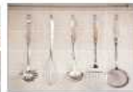
용도별 조리도구 구분 사용