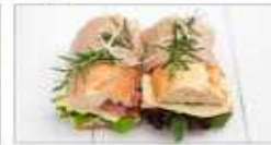
보급자에 의해 조리된 식품 (도시락, 샌드위치)