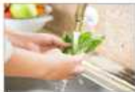
흐르는 물에 3회 이상 세척