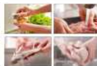
채소류→육류→어패류 →가금류 순으로 세척