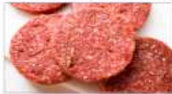
쇠고기(특히 간 쇠고기, 햄버거) 및 쇠고기 육제품(햄, 소시지)